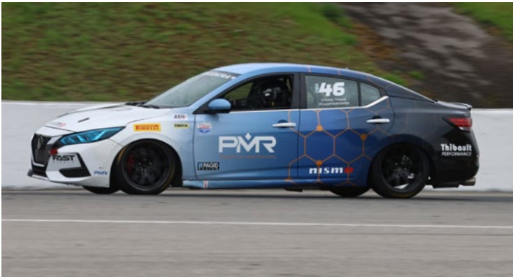
46 Christian Thibault Blainville, QC