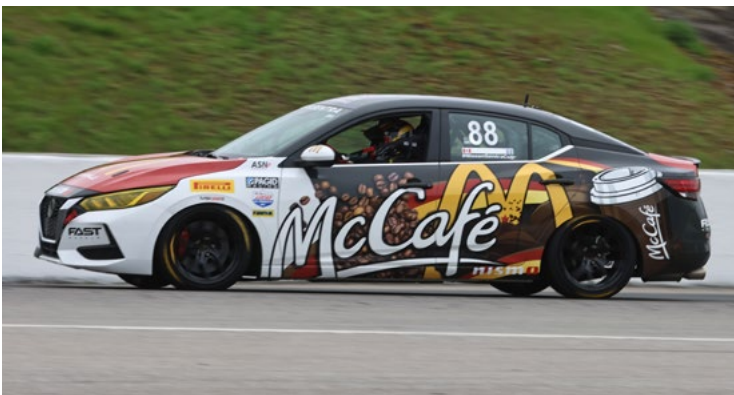
88 Rénaud Hamelin Trois-Rivières, QC