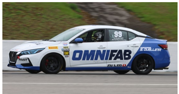
99 Sylvain Ouellet Louiseville, QC