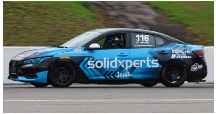
116 Éric Chaput St-Augustin-de-Desmaures, QC