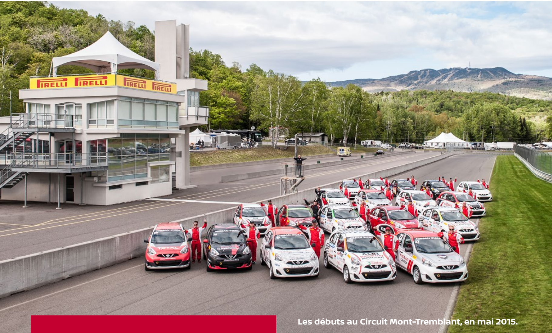
Les débuts au Circuit Mont-Tremblant, en mai 2015.