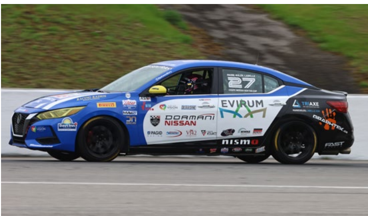
27 Marie-Soleil Labelle Gatineau, QC