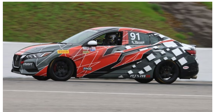
91 Simon Vincent St-Jérôme, QC