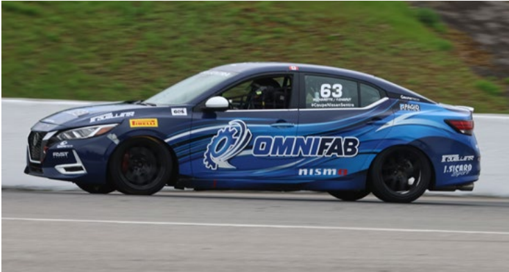
63 Frédéric Chaput Québec, QC