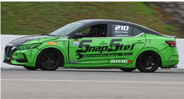
210 Stéphane Pouliot Saguenay, QC