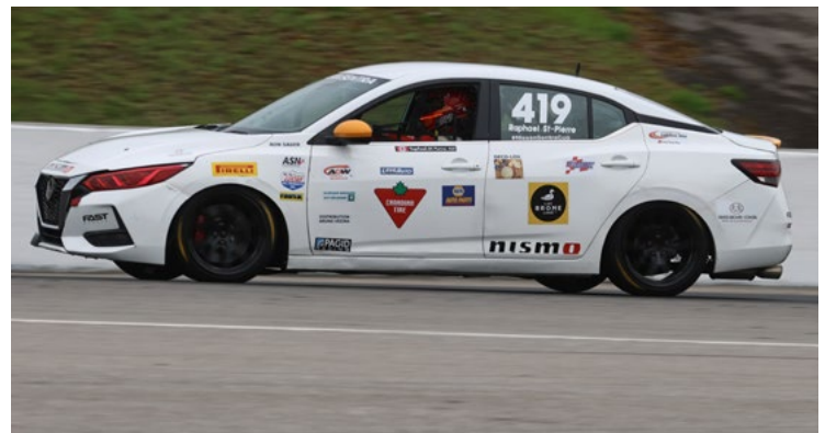
419 Raphaël St-Pierre Trois-Rivières, QC