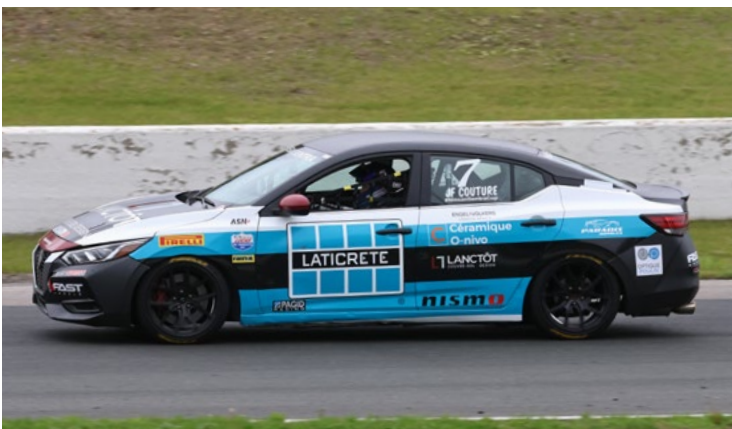
7 Jean-François Couture Mont-St-Hilaire, QC